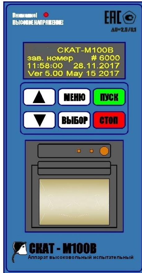
Рис.2 Передняя панель управления

3.6 При подаче высокого напряжения загорается индикатор "Внимание! ВЫСОКОЕ НАПРЯЖЕНИЕ". Все режимы аппарата, а также параметры измерения напряжения пробоя отображаются на OLED дисплее.